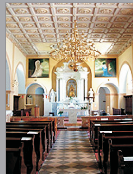
SVETIŠTE MAJKE BOŽJE GORIČKE