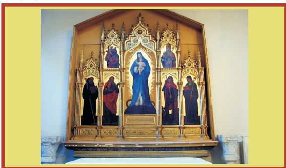
Vivarinijev poliptih iz crkve sv. Andrije ap. - benediktinki u Rabu

Creski samostan sa crkvom sv. Petra potječe iz XV. st. Ovdje su sestre najbrojnije: ima ih 12.